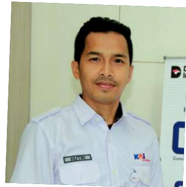
Hutri Pelaksana Perawatan Harian Dipo Depok

Semoga KAI Commuter terus menjadi transportasi publik yang efisien dan pilihan utama masyarakat Indonesia. Saya juga berharap KAI Commuter dapat terus meningkatkan kesejahteraan Insan KAI Commuter, terutama dalam hal fasilitas kesehatan.