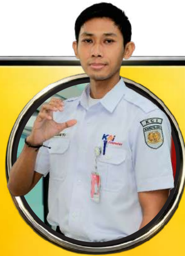
Tri Mukti Sukatmo Authorization and Monitoring Staff

Hal paling mendasar untuk mewujudkan keselamatan kerja adalah menerapkan budaya safety secara konsisten. Di KAI Commuter, hal itu diwujudkan melalui lima budaya keselamatan."